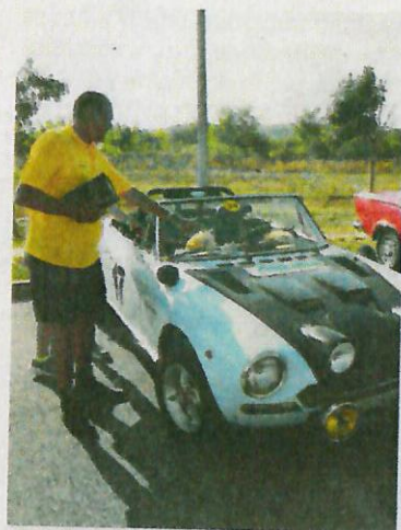
Sany August s automobilom Fiat Sport Spider

Kolekcionar automobila iz Selca kod Crikvenice ponosni je vlasnik jedina tri primjerka Fiat Sport Spidera američke proizvodnje